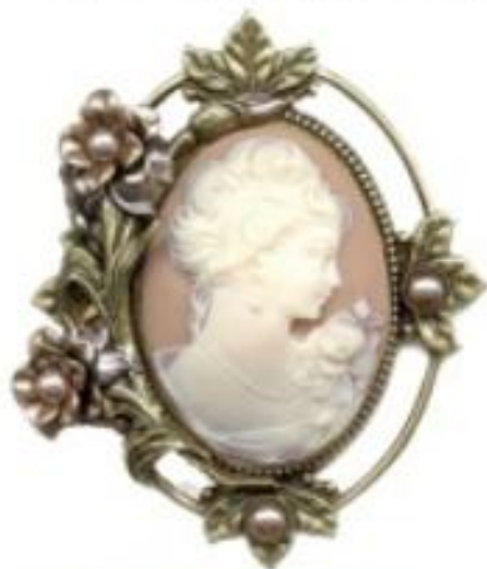
Ка́мея — ювелирное изделие, выполненное в технике барельефа на драгоценных камнях.